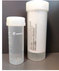
Sputumgefäße (Fa. Sarstedt)